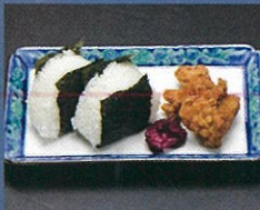
おにぎりセット 400円+税