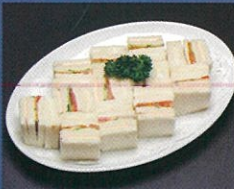
サンドイッチ(5人盛) 2,000円+税