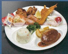
お子様ランチ 1,200円+税

・おにぎりセットは、持ち帰り可能な容器でお届け致します。・サンドイッチのご注文は、前日の午前中までにお問い合わせ致します。 ・お子様ランチは、その他のご注文に合わせた容器でお届け致します。