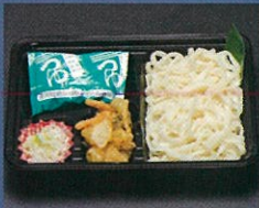
ミニかき揚げうどん 450円+税